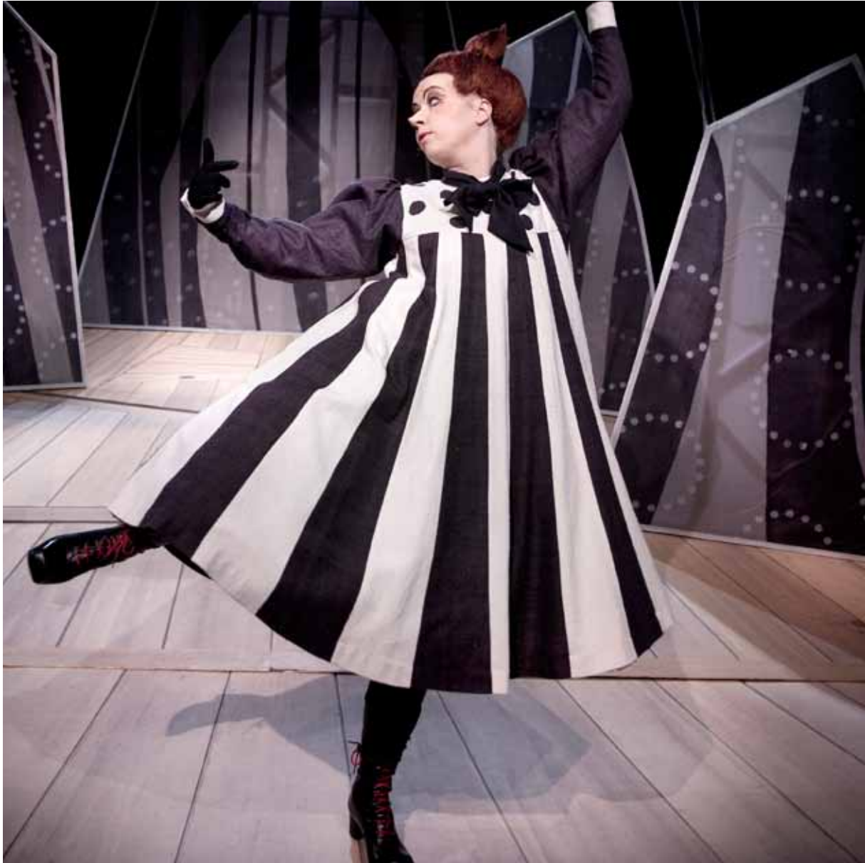
Lilla My i föreställningen