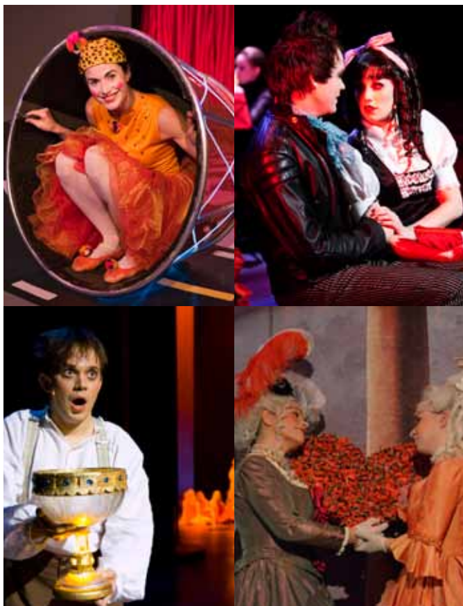
Flygande trumman, Fantasticks, Trollguld & Vivaldis vinter