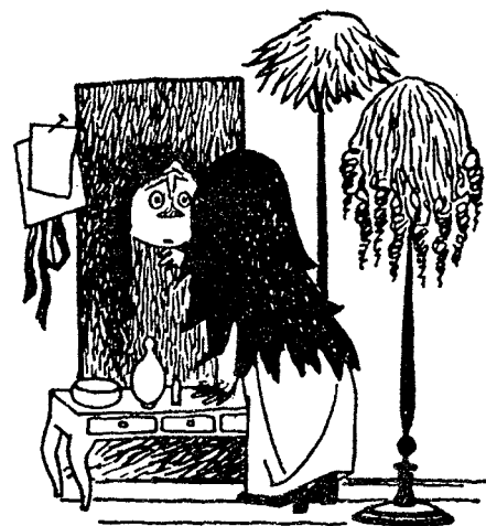
Misan som primadonna

Barnen myllrar runt i salen. Ledaren ropar ut två siffror, t ex 3 och 7. Den första siffran anger hur många deltagare det ska vara i varje grupp. Den andra siffran berättar hur många kroppsdelar som varje grupp tillsammans ska ha i golvet. Viktigt att övningen sker under tystnad, samt att ledaren ser till att den första siffran är jämnt delbar med antal barn i klassen.