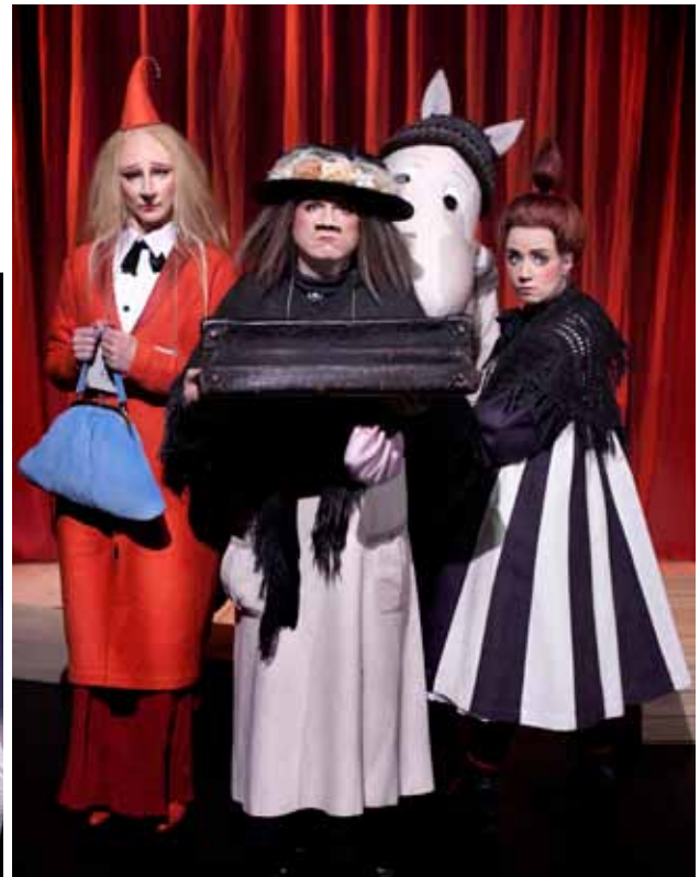
Från föreställningen